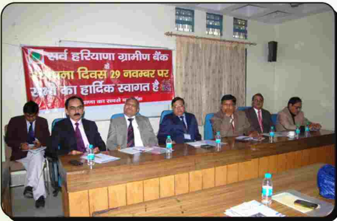
सर्व हरियाणा ग्रामीण बैंक के स्थापना दिवस पर आयोजित कार्यक्रम में उपस्थित चैयरमैन व महाप्रबन्धकगण