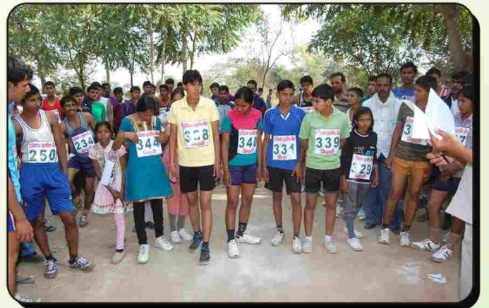
सर छोटू राम जयन्ती पर बैंक द्वारा दैनिक हरिभूमि के सहयोग से आयोजित हाफ मैराथन में भाग लेने वाले प्रतिभागी।