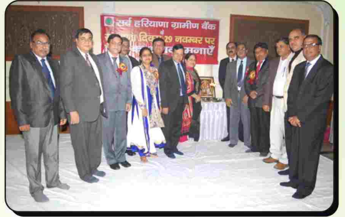
बैंक के प्रथम स्थापना दिवस के सुअवसर पर दीप प्रज्ज्वलित करते हुए बैंक अध्यक्ष, महाप्रबन्धक गण व क्षेत्रीय प्रबन्धक गण।