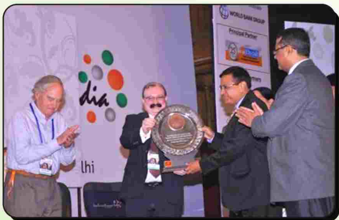
नाबार्ड एवं जर्मनी की कम्पनी गिज़ द्वारा बैंक को Inclusive Finance India Award 2014 से विभूषित किया गया। बैंक की ओर से सम्मान ग्रहण करते बैंक अध्यक्ष