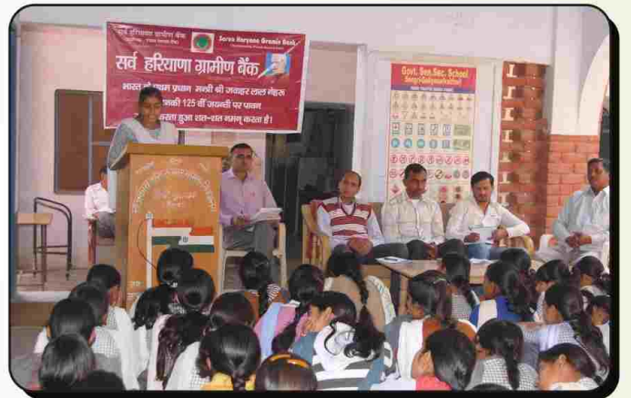
सर्व हरियाणा ग्रामीण बैंक की शाखा गुलियाणा द्वारा बाल दिवस का आयोजन किया गया। इस अवसर पर भाषण प्रतियोगिता में भाग लेते प्रतिभागी।