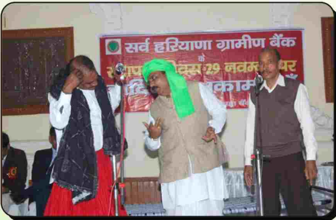
स्थापना दिवस के सुअवसर पर सांस्कृतिक समारोह में हरियाणवी स्विट का मंचन करते बैंक के अधिकारीगण।