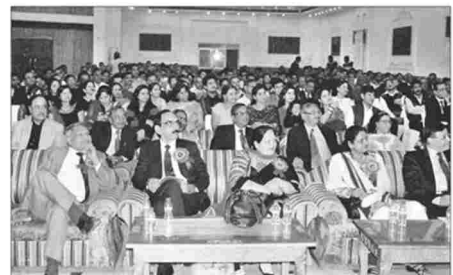
रोहतक। सर्व हरियाणा ग्रामीण बैंक के प्रथम स्थापना दिवस की वर्षगांठ पर आयोजित कार्यक्रम में उपस्थित बैंक के अधिकारी व कर्मचारी।