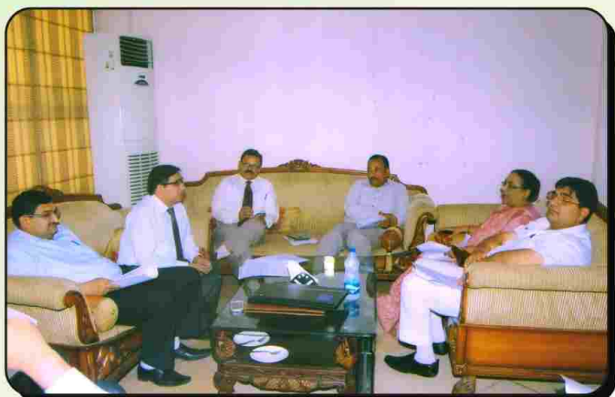
बैंक की बोर्ड मीटिंग में वार्षिक रिपोर्ट पर चर्चा करते निदेशक मण्डल